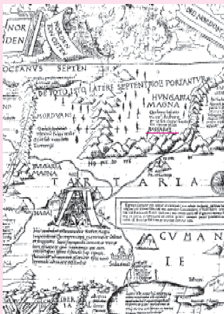
IV. Карта М. Вальдземюллера (Carta Marina). Фрагмент. 1516 г.

проведены в 16 направлениях) и является, таким образом, одним из ранних атласов карт-портланов. По сравнению с Mappa mundi , на Каталонской карте Иерусалим расположен не в центре. В 1381 г. Каталонская карта была отправлена во Францию в подарок королю Карлу VI и в настоящее время хранится в Национальной библиотеке в Париже. Часть Каталонского атласа мира впервые опубликовал в России в 1873 г. профессор Новороссийского (Одесского) университета Ф.К. Брун. На левом берегу Камы показаны посе-