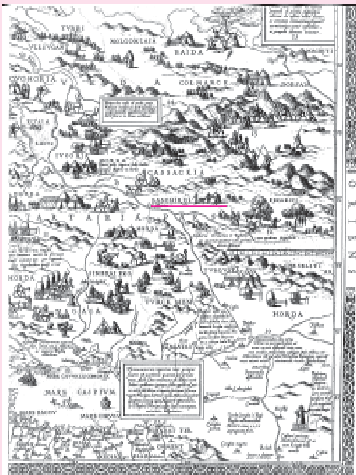
VII. Карта МосковиИ Й. и Л. Деутекумов. Фрагмент. Около 1570 г.

Карта С.Герберштейна интересна тем, что почти вся территория Южного Урала и Приуралья покрыта лесом, за исключением отдельных незначительных участков, отнесенных, по всей вероятности, к степям 12 .