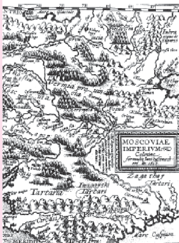
vIII. Карта Московии М.Куэйда. Фрагмент. 1600 г.

Агнезе 1525 г. была составлена по сведениям, полученным от направленного в Рим Великим князем Василием Ивановичем главы посольства Московского государства Дмитрия Герасимова 17 . К.А. Салищев констатирует, что: «...иностранцы, авторы позднейших карт Московского государства XVI и XVII вв., нередко ссылаются на русские материалы. Возможность составления сколько-нибудь обстоятельной карты России без привлечения этих источников была исключена» 18 . Подробное источниковедческое исследование европейских карт этого периода провел Б.А. Рыбаков, который также указывает на использование иностранцами русских источников 19 .