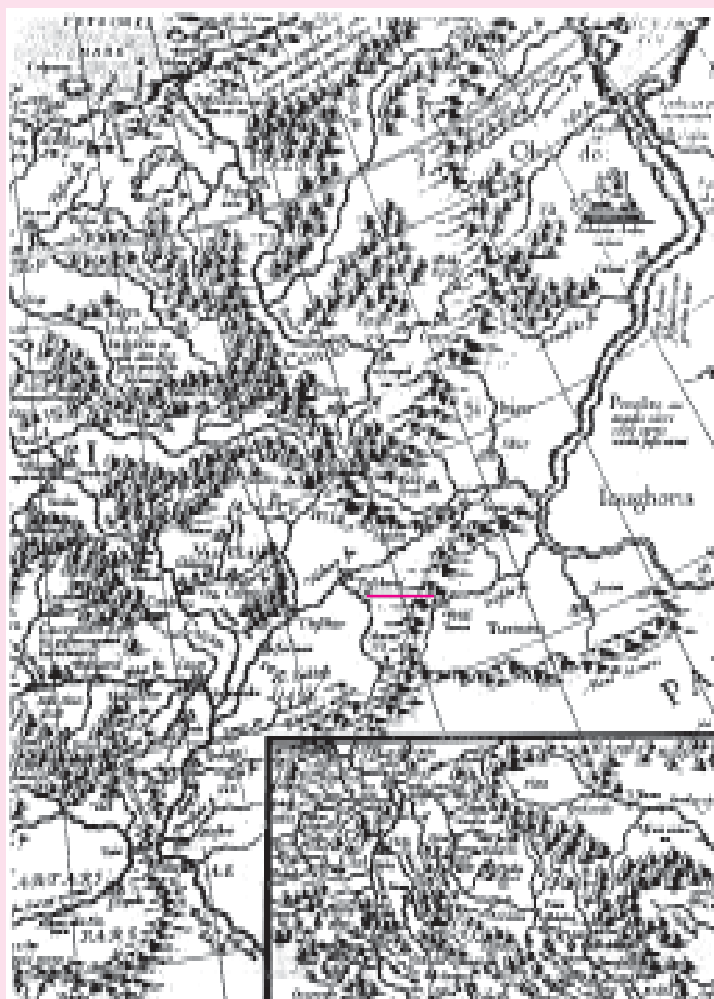
У. Карта России Г. Меркатора. Фрагмент. 1554 г.

кой сетки. Отражение объектов на карте свидетельствует, что Фра-Мауро был хорошо знаком с трудами Птолемея и арабских географов. Более 5-й части карты занимает изображение России (Rossia). В объяснении мы читаем: «...эта величайшая земля граничит на востоке с Белым морем, на западе с морем немецким, на юге с Сараем (у Каспийского моря) и с Куманией, а на севере с Пермией. Она (Россия) имеет величайшие реки, особенно Эдиль (Волга), которая не меньше Нила».