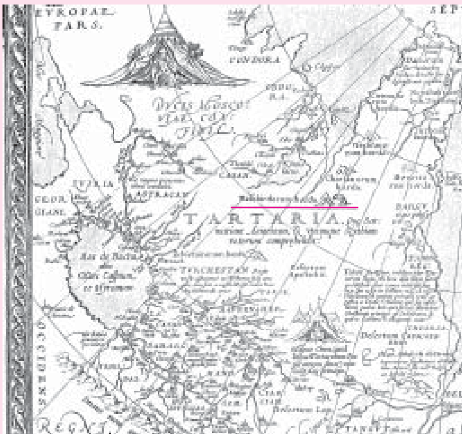
VI. Карта Тартарии А.Ортелия. Фрагмент. 1570 г.

Уральские горы (Hyperborei montes) – они тянутся с запада на восток, Великая Булгария (Bulgaria Magna), Ногаи (Nagai), Мордва (Mordvani), Башкиры (Bastarci), Казань (Casana) и др. На карте к югу от Mordvani имеется примечание: « Qui hanc habitant regionem, Bileri vocantur et sunt sub mandato Tartarorum » («Те, кто живут на этих землях, зовутся Билярами и живут под управлением Татар»). М.Вальдземюллер отождествляет Великую Венгрию (Hungaria Magna) с Башкортостаном. Под заголовком Hungaria Magna сделано следующее пояснение: « qui hanc habitant vocantur Bastarci et sunt sub imperio Tartarorum