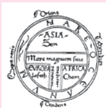
I. Карта типа «Т-О» монаха Исидора из Севильи. Около 600 г.