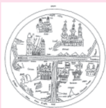
II. Карта типа «Т-О». Лейпцигская карта. XI в. Германия.

Более достоверные и довольно подробные сведения о регионе содержатся в европейских историко-географических сочинениях и картах средневековья, что было связано, безусловно, с проникновением купцов, дипломатов и миссионеров на территорию Башкортостана.