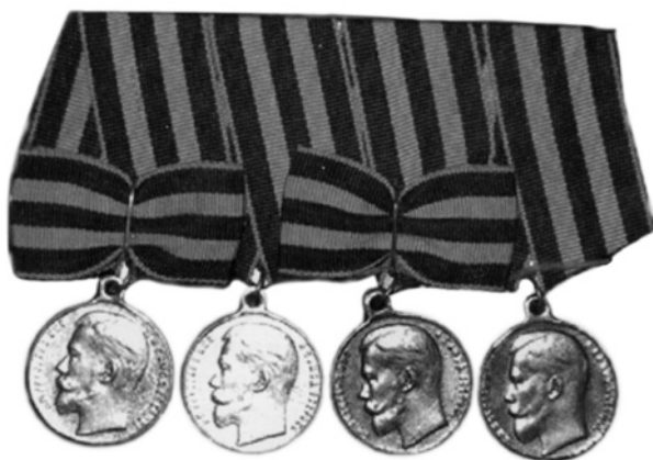
Георгиевские медали (полный бант).