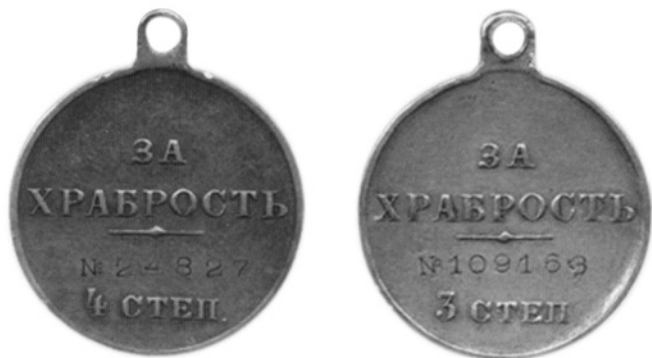
Реверс Георгиевских медалей.