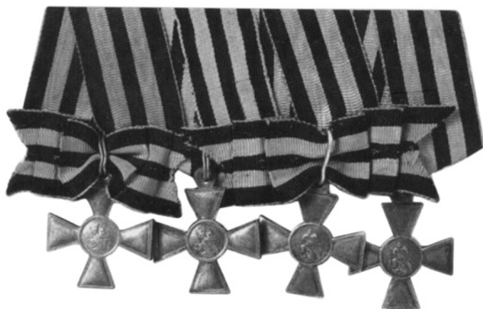
Георгиевские кресты (полный бант).