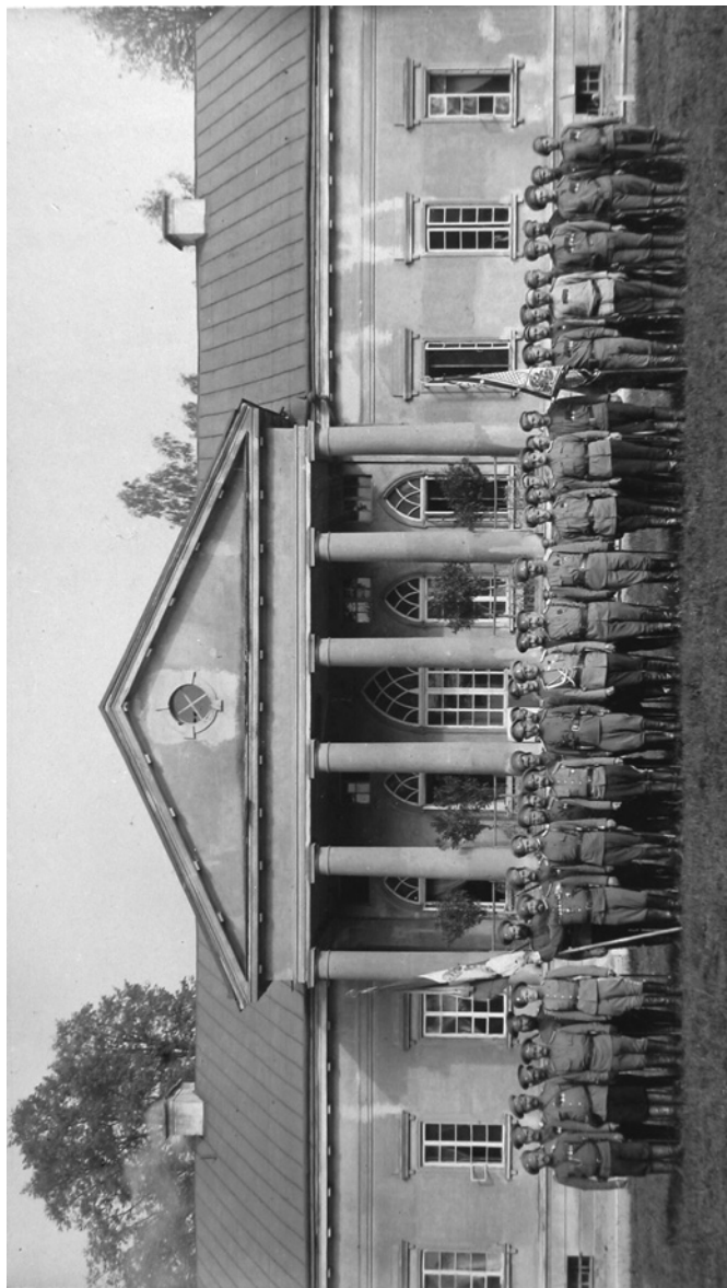
Офицеры и нижние чины 18 ОКП. 1915 г.