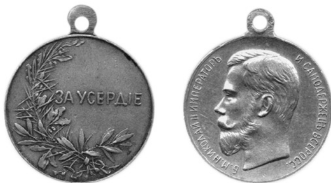
Реверс (слева) и аверс (справа) серебряной медали «За усердие».