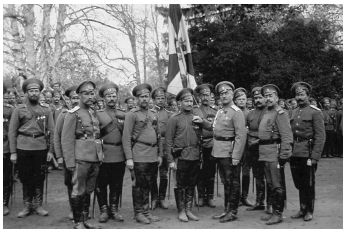
Вручение Георгиевского креста казаку 18 ОКП. 1915 г.