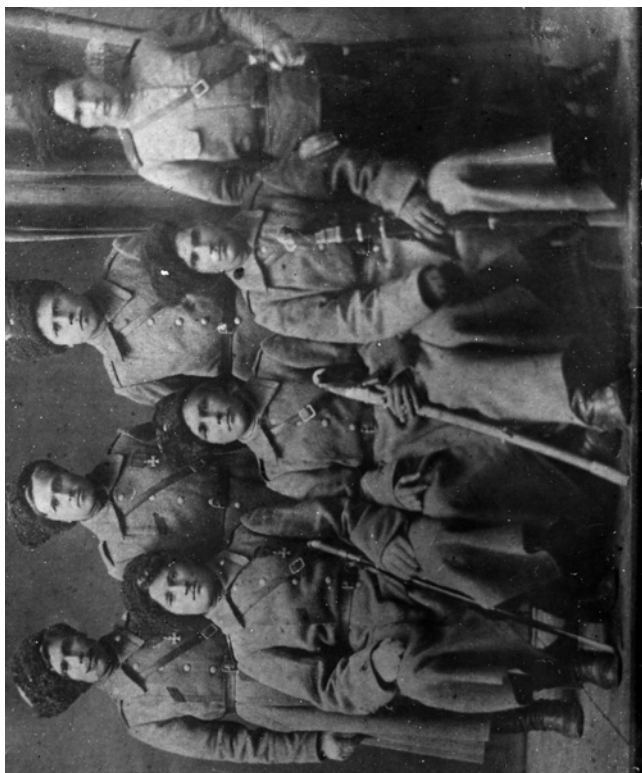
Казаки Звериноголовской станицы