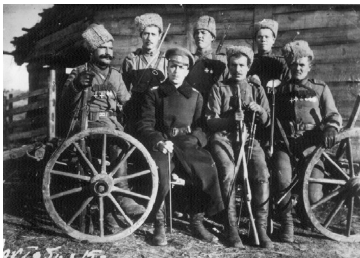
Казаки 3 ОКП. 1916 г.