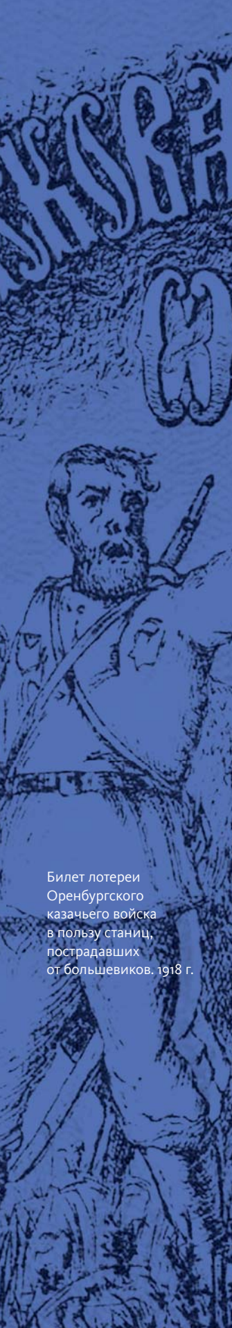
Билет лотереи Оренбургского казацкого войска в пользу станиц, пострадавших от большевиков. 1918 г.

16 января произошло решающее столкновение под станцией Каргала, в котором приняли участие даже 14-летние оренбургские кадеты, откликнувшись на призыв Дутова. Однако положение белых было безнадежным.