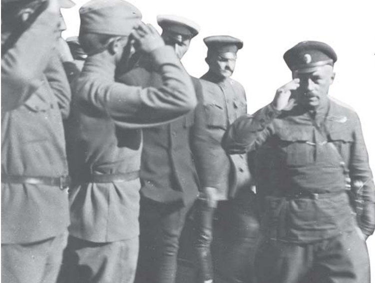
Встреча атамана А. И. Дутова в Самаре. Июль 1918 г.

«НАС НАЗЫВАЮТ РЕАКЦИОНЕРАМИ. Я НЕ ЗНАЮ, КТО МЫ: РЕВОЛЮЦИОНЕРЫ ИЛИ КОНТРРЕВОЛЮЦИОНЕРЫ, КУДА МЫ ИДЕМ — ВЛЕВО ИЛИ ВПРАВО. ОДНО ЗНАЮ, ЧТО МЫ ИДЕМ ЧЕСТНЫМ ПУТЕМ К СПАСЕНИЮ РОДИНЫ»