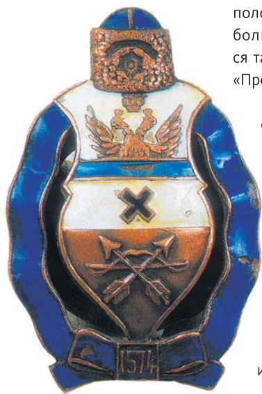
Нагрудный знак Оренбургского казачьего войска. 1912 г.

В конце ноября 1917 г. Дутова избрали депутатом Учредительного собрания от Оренбургского войска. Не рассчитывая на захват власти изнутри, большевики приступили к внешней блокаде города. По железной дороге в Оренбург не пропускали продовольствие, также блокировался и проезд пассажиров, в том числе возвращавшихся с фронта солдат, что приводило к скапливанию их на станциях и росту недовольства.