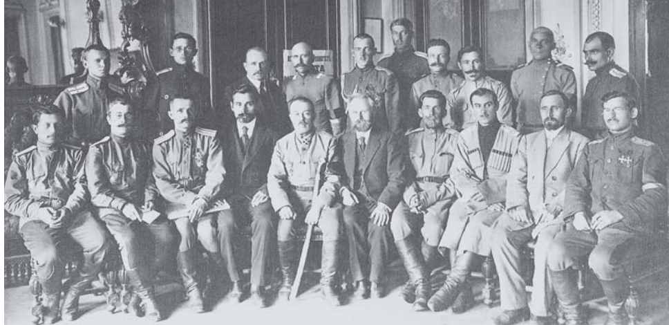
Всероссийский съезд казачьих частей. Президиум съезда во главе с атаманом А. И. Дутовым. Петроград, 7 июля 1917 г.

председателем второго съезда единогласно выбрали готовившего его созыв Дутова. Вскоре он стал председателем Совета Союза казачьих войск.