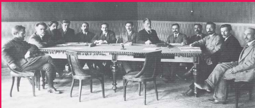
Комитет членов Учредительного собрания (Комуч). Самара, 1918 г.

В одном из выступлений Дутов заявил о своем политическом курсе: «Нас называют реакционерами. Я не знаю, кто мы: революционеры или контрреволюционеры, куда мы идем – влево или вправо. Одно знаю, что мы идем честным путем к спасению Родины». Сам Дутов был сторонником программы кадетской партии. Его власть на Южном Урале отличалась демократизмом и терпимостью к различным политическим течениям, вплоть до меньшевистского.