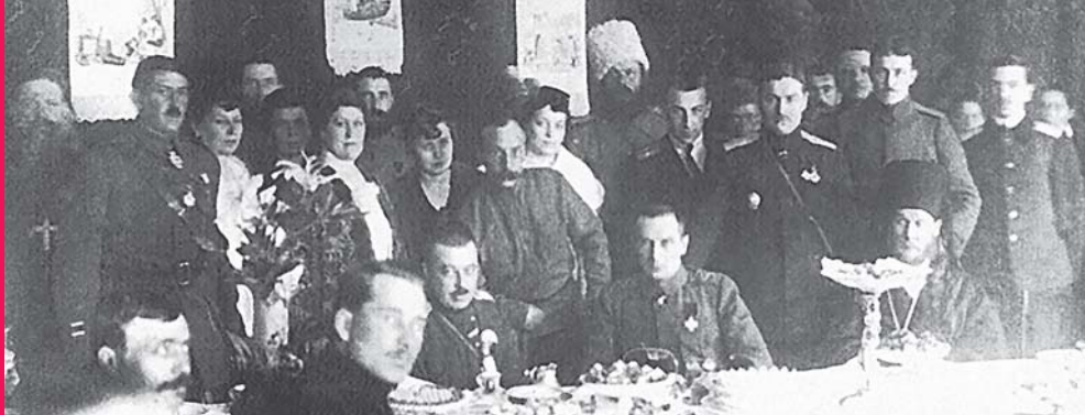
А. И. Дутов и А. В. Колчак (сидят в центре) на банкете. Февраль 1919 г.

Атаман казачьих войск А. И. Дутов. 1919 г.