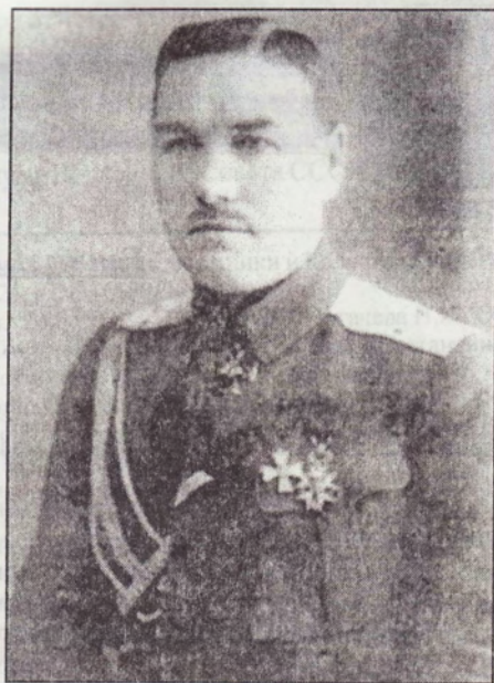
Генерал-майор Генерального Штаба Акулинин Иван Григорьевич. Фото не ранее октября 1918 г.

3). Составить на основе ежегодных донесений Наказных атаманов на Высочайшее имя и сношений с Главным управлением казачьих войск особый военно-статистический очерк Оренбургского войска;