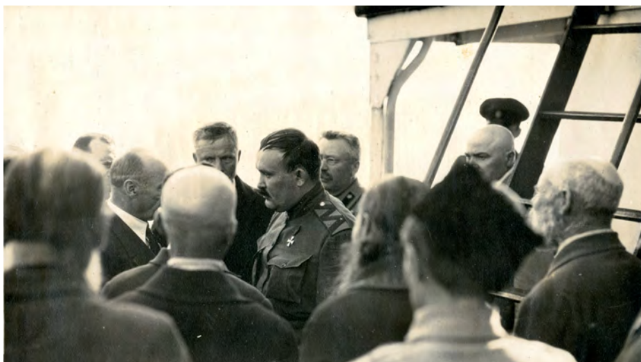
Атаман Г.М. Семенов на пароходе «Киодо-Мару» во Владивостоке. Начало июня 1921 г. Публикуется впервые

Вскоре ген[ерал] Панов и часть присных с ним уехали в распоряжение ген[ерала] Вержбицкого, и жизнь оренбуржцев вошла в колею.