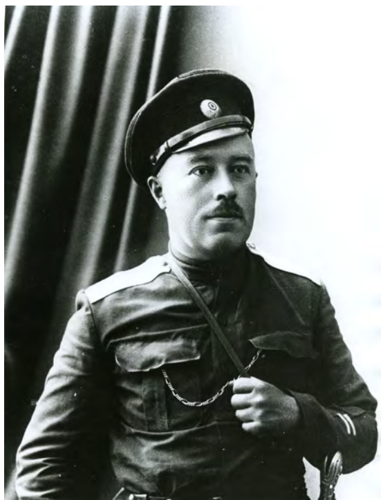
Атаман А.И. Дутов. 1918 г.

ствие в Тобольско-Петропавловской операции. В начале 1920 г. остатки полка дошли до Забайкалья.