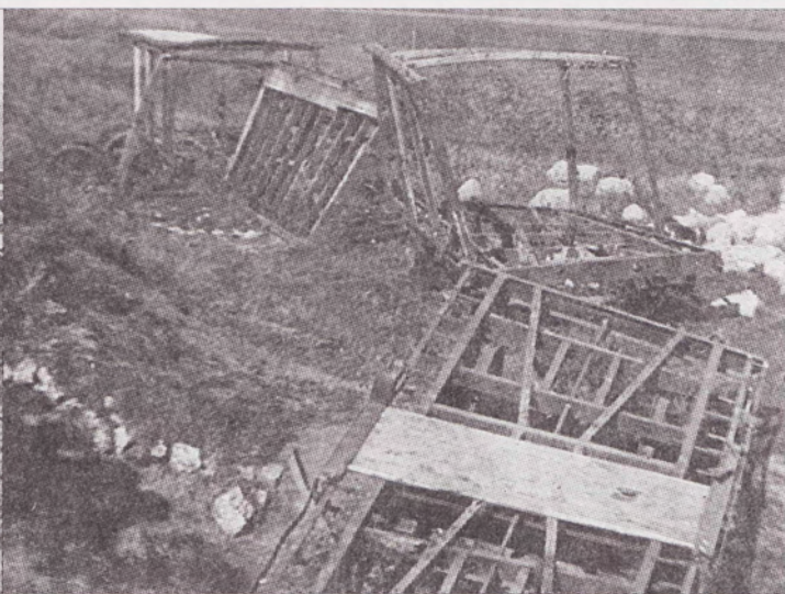
Разрушения на Ташкентской железной дороге (участок Оренбург-Актюбинск). (Центральный музей вооруженных сил).

торию войска) 34 . Среди казаков подавляющее большинство составляли православные. Имелось 4,6 % старообрядцев. Значителен был удельный вес мусульман (татары и башкиры). По губернии к 1897 г. национальный состав распределялся следующим образом: 70,4 % - русские, 15,9 % - башкиры, 5,8 % - татары.