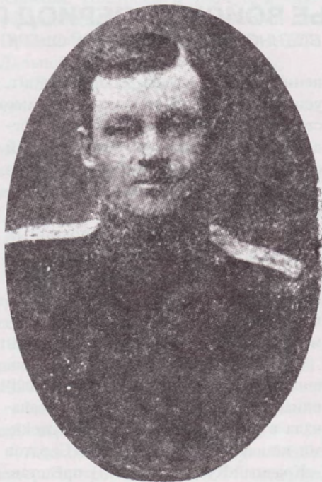
Командир Отдельного Оренбургского казачьего полка в Забайкалье генерал-майор А.В. Зувев. 1921 г..