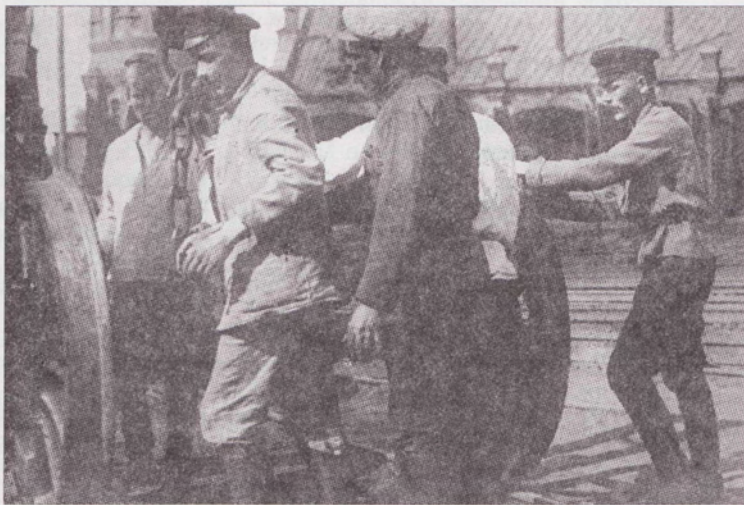
Субботник на железнодорожной станции Оренбург. Весна 1919 г..

Все фотографии из фондов Центрального музея вооруженных сил (ЦМВС) публикуются впервые.