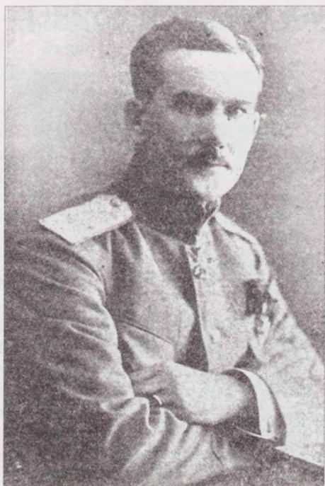
Начальник Оренбургской казачьей бригады в Забайкалье генерал-майор В.А. Бородин. 1921 г..