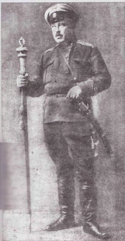
Атаман Оренбургского казачьего войска генерал-лейтенант А.И. Дутов. 1919 г. (ГАРФ).

Один из вариантов наступления Восточного фронта адмирала А.В. Колчака весной 1919 г. предусматривал выход белых сил к Волге в районе Самары в результате продвижения с территории Оренбургского казачьего войска.