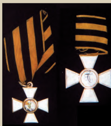
Самая почетная и высокая боевая офицерская награда — орден Св. Георгия 4-й степени (лицевая и оборотная стороны).