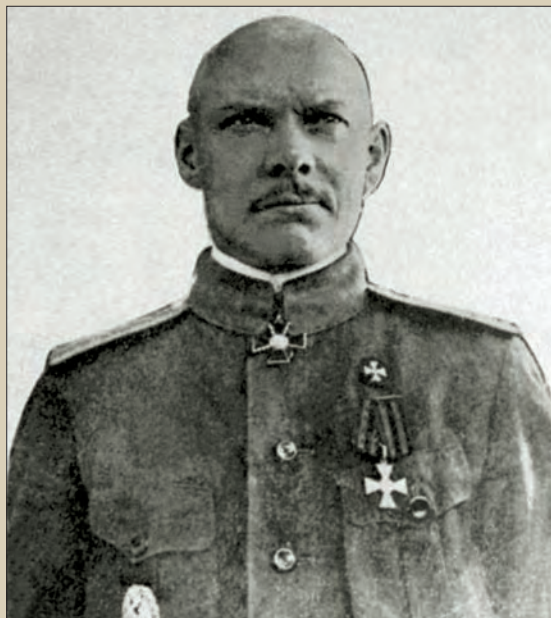
Иван Матвеевич Зайцев

СРЕДИ БИОГРАФИЙ РУКОВОДИТЕЛЕЙ АНТИБОЛЬШЕВИСТСКОГО ДВИЖЕНИЯ В РОССИИ ОБРАЩАЕТ НА СЕБЯ ВНИМАНИЕ УДИВИТЕЛЬНЫЙ, ЧЕМ-ТО ПОХОЖИЙ НА ДЕТЕКТИВ ЖИЗНЕННЫЙ ПУТЬ ГЕНЕРАЛ-МАЙОРА ИВАНА МАТВЕЕВИЧА ЗАЙЦЕВА.