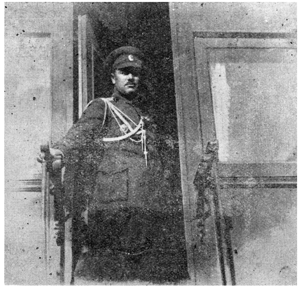
Полковник И.Г. Акулинин. Лето 1918 г. [Оренбургский казак. Харбин, 1937]

По возвращении из Тургая помощник Войскового атамана Генштаба полковник Акулинин назначается сначала помощником командующего войсками Оренбургского военного округа, а затем (с 19 октября 1918 г.) главным начальником округа [45,