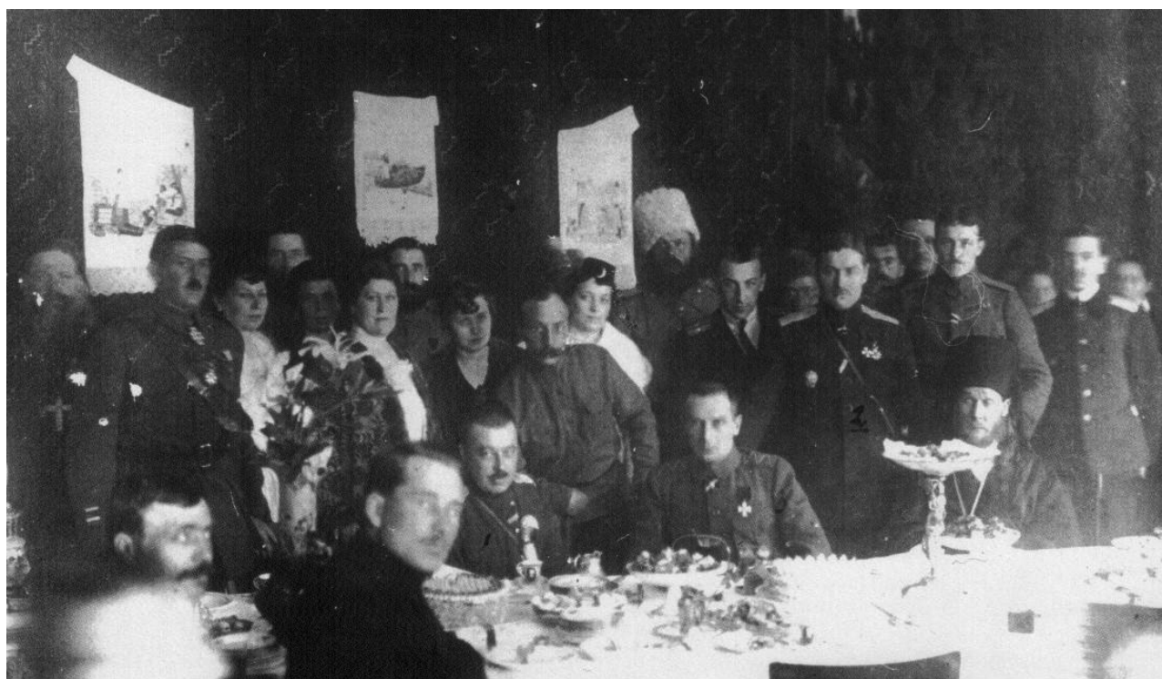
А.И. Дутов, А.В. Колчак, И.Г. Акулинин и архиепископ Мефодий (Герасимов) на банкете в честь Верховного Правителя. Троицк. Февраль 1919 г.

ных на фронте, и, находясь под постоянной угрозой флангового удара с севера, части корпуса были вынуждены отходить в надежный тыл – на станицы 2-го (Верхнеуральского) военного округа. Уже 20 февраля был оставлен Кувандык, а 22 февраля в результате обхода красных корпус потерял всю свою и без того ничтожную артиллерию (2 орудия).