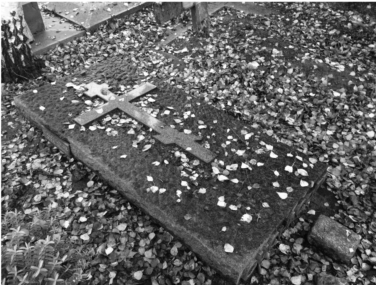
Рис. 5. Могила И.Г. Акулинина на кладбище Сент-Женевьев де Буа под Парижем 2014 г.