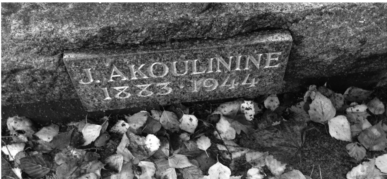
Рис. 6. Могила И.Г. Акулинина на кладбище Сент-Женевьев де Буа под Парижем 2014 г.