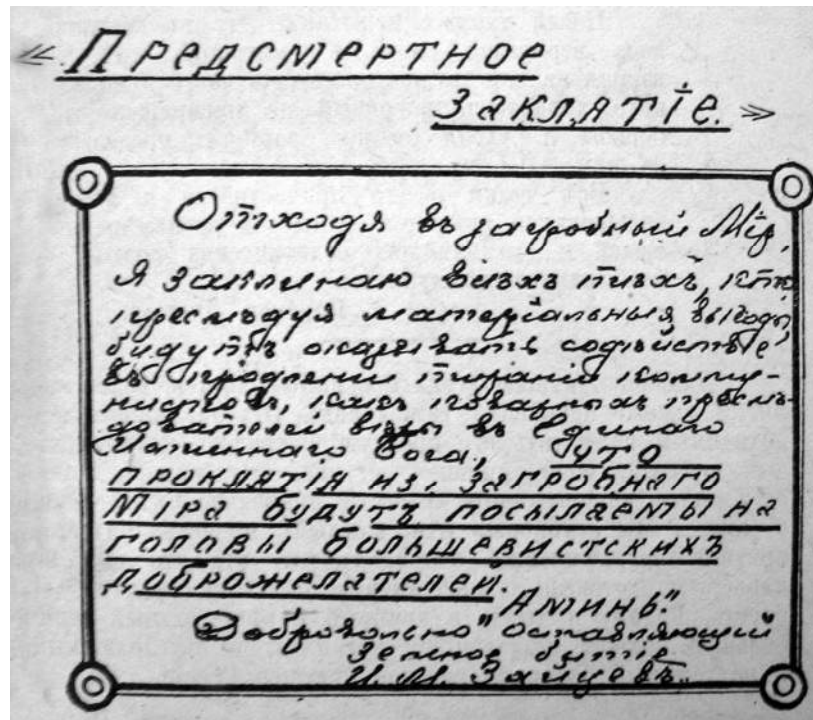
Рис. 4. Предсмертная записка генерала И.М. Зайцева, опубликованная в книге его воспоминаний Fig. 4. The immortal note of General I.M. Zaitsev, published in the book of his memoirs

ской лагерной системы и предвосхитивших знаменитый «Архипелаг ГУЛАГ» А.И. Солженицына (Зайцев И.М., 1931). Наконец, опровергается это и самоубийством генерала по причине недоверия эмиграции.