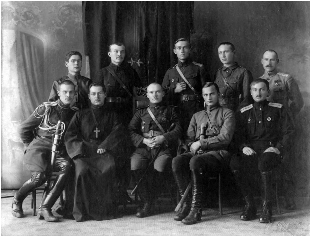
Рис. 1. Генерал И.М. Зайцев предположительно с членами своей военно-дипломатической миссии. Китай, 1920 г. Музей русской культуры в Сан-Франциско Fig. 1. General I.M. Zaitsev probably with members of his military-diplomatic mission. China, 1920. Museum of Russian Culture in San Francisco

вовал ли Зайцев в чем-либо, невозможно. Отметим, что подобные инициативы могли находиться в русле декларированных им тайных целей, поскольку позволяли легально перебрасывать в СССР белогвардейцев. Таким образом, представленные документы не опровергают утверждения самого Зайцева о тайных целях проникновения в СССР. Более того, сам Зайцев в эмигрантских воспоминаниях упоминал, как о попытках наладить контакты с властями СССР, так и о своих встречах с различными партийно-государственными деятелями. Эти признания свидетельствуют в пользу достоверности мемуаров. Так, генерал описал свою встречу с редактором «Известий» Ю.М. Стекловым по поводу неточностей газетной заметки о нем (Зай-