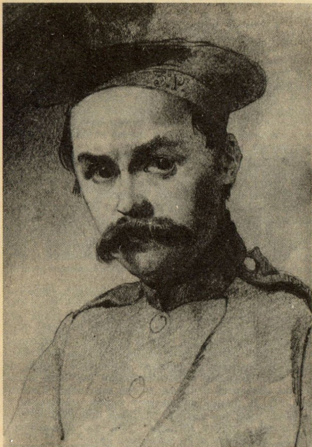
Т. Шевченко Автопортрет 1847